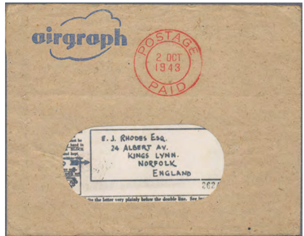
ex Los 110