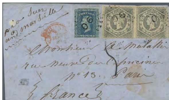
ex Los 102